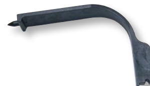
Setzwerkzeug für Kralle