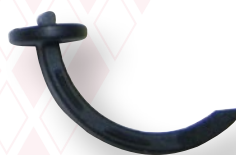
Kralle für Noppenfolie/Klett-TPK-System